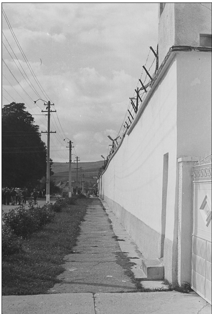
A szamosújvári börtön bejárata felé bandukolva (1996)