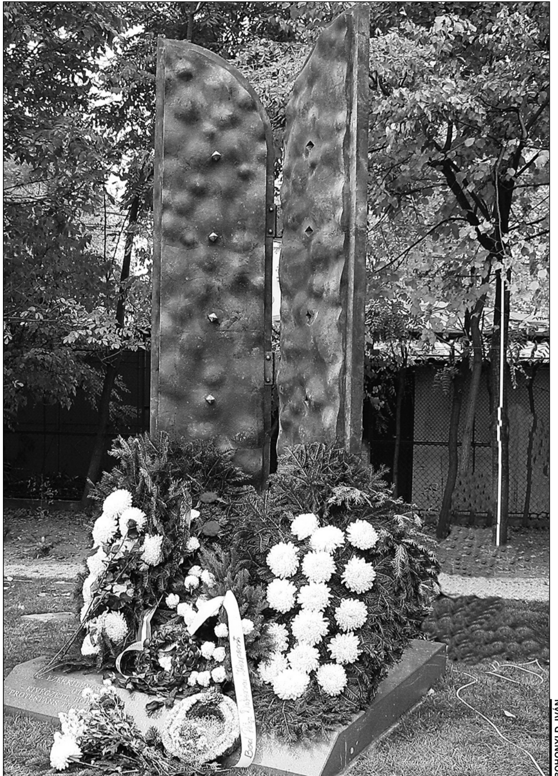
Az 1956-os emlékmű a kolozsvári Protestáns Teológia udvarán