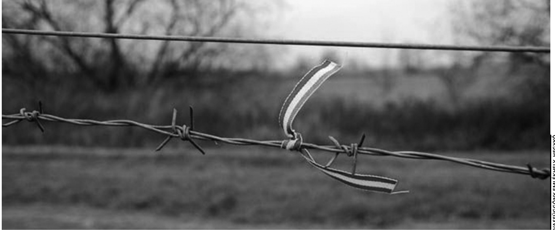
VASFÜGGÖNY EMLÉKHELY, HEGYKŐ

Magyarország és Ausztria az 1956-os forradalom idején