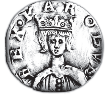
Károly aranyforintja (balra) és ezüstdénárja