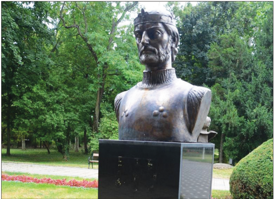
Temesváron tavaly állítottak emléket az egykor ott székelő Károlynak (feliratát ismeretlenek eltávolították)

A letűnt kiskirályok helyébe a régebbi nemzetségek föllemelkedő családjai, a Lackfiak, Szécsiek, Szécsényiek, Debreceniek és a bevándorolt Drugethek léptek, akik ugyanolyan hatalmas birtokadományokban részesültek, mint elődeik. A királyi birtok jelentőségének csökkenését felismerve, Károly kiépítette a váruradalmak új formáját, s a királyi jövedelmeket a bányák, a pénzverési regále (királyi haszonbér; koronajövedelem) és új adók bevezetésével növelte. 1323 után tárnokmestere, Nekcsei Demeter segítségével alapvető gaz-