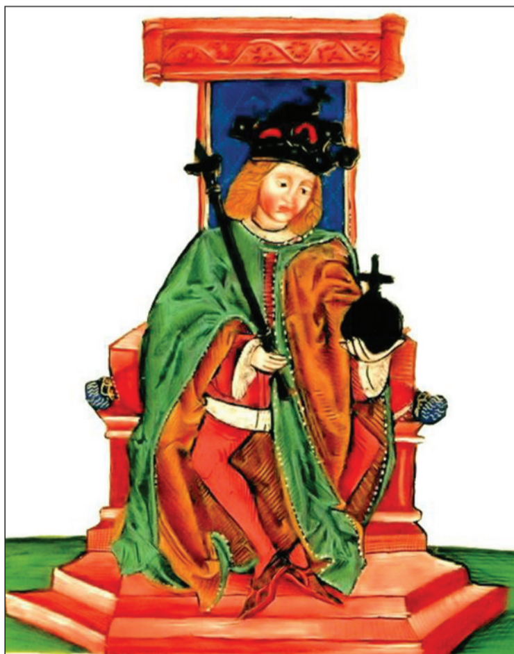
Így ábrázolja Károly Róbertet a Thuróczy krónika

1330-ban hadjáratot indított Baszarab havasalföldi vajda ellen, aki gyakran támogatta Kán Lászlónak a Károly ellen lázadó fiait, és egyéb módon is megszegte hűbéri esküjét. Argyasnál (Curtea de Argeș) megegyezett a színleg meghódoló vajdával. Ha-