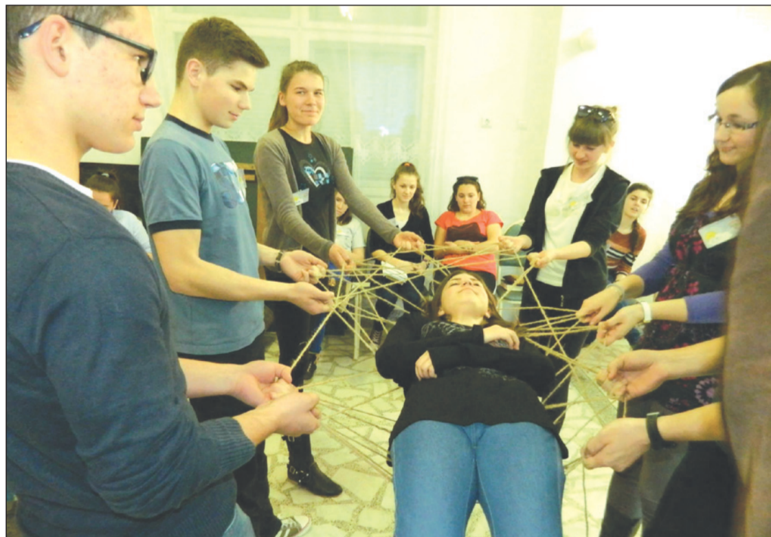
Az IKE közösség akár egy életen át elkísér

– Összel rendkívüli IKE Közgyűlést tartunk, ahol a reményeink szerint a nyáron jóváhagyott új felépítés alapján választunk majd új elnökséget. Onnan kezdve a következő évek az építkezésről szólnak. Azon kell dolgoznunk, hogy tartalommal töltsük fel, és emberekre, személyes kapcsolatokra érezzük ki a szervezet életét. Emiatt nagyon sok terepmunka vár a munkatársakra – vázolta a következő időszak feladatait. – Ha kiépül az egyházmegyei szintű szervezet, akkor az országos elnökségnek már csak ezzel az elnökséggel kell tartania a kapcsolatot. Illetve régiókénti irodákat működtetnénk, adminisztrációs célból, Algyógyon, Marosvásárhelyen, Kolozsváron és Sepsiszentgyörgyön. A regionális kapcsolattartás azért is előnyösebb, mert az országos vezetőség Kolozsvárról nem tudja felmérni az egyházmegyeként változó igényeket – tette hozzá a programkoordinátor, aki bízik a szerkezeti átalakulás gördülékenységében.