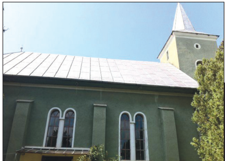
Elfogyóban, mégis hittel bizakodó a bodonkúti gyülekezet